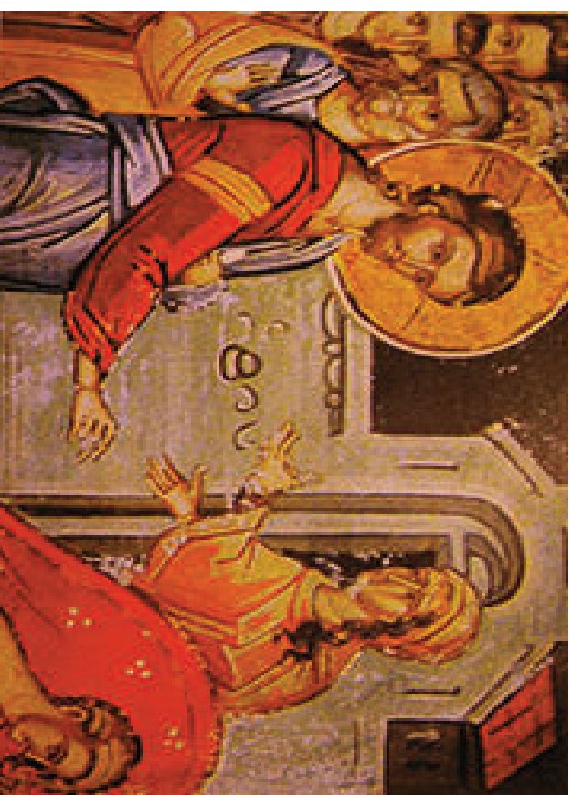
Еванђеље по Матеју 15.21-28

И изишавши оданде Исус се повуче у крајеве Тира и Сидона. 22 И где, жена Хананејка изиђе из оних крајева и повика говорехи: смилуј се на мене, Господе, сине Давидов, моју ћерку демон тешко мучи. 23 А он јој не одговори ни речи. Тада приступише његови ученици и мољаху га говорехи: отпусти је, јер вице за нама. 24 Али он одговори и рече: ја сам послан само изгубљеним овцама дома Израилјева. 25 Она пак дође и клањаше му се говорехи: Господе, помози ми. 26 А он одговори и рече: није лепо узети дечији хлеб и бацити га псима. 27 Она рече: да, Господе; али и пси једу од мрва што падају са трпезе њихових господара. 28 Тада Исус одговори и рече јој: о, жено, велика је твоја вера. Нека ти буде како желиш. И би излечена њена кћи од онога часа.